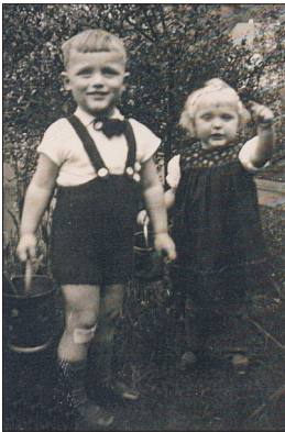
Bubi und Didi

Bereits vor meiner Geburt wohnten wir in Dillenburg. Der Umzug war durch den Beruf meines Vaters nötig geworden. Meine Mutter trauerte ihr Leben lang um Kassel, in dieser so schönen Stadt wohnte sie so gern.