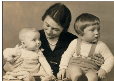
Bubi und Didi